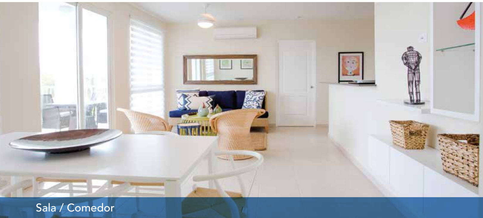
Sala / Comedor